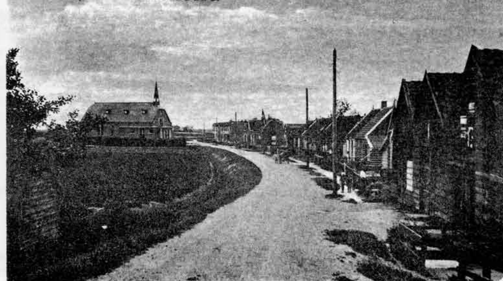
SPAARNDAM Ringweg met R. K. Kerk

Als redactie laat je je gedachten bij een dergelijk artikel ook wel eens gaan.